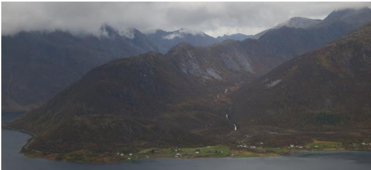
Figur 2. Våtvoll med sine stryk og fosser sett fra Moelv.

Området er en del av et gammel sjøsamisk landskap. Dalen er relativt lukket, men med god utsikt blant annet mot Gullhornet og Moelv-området. Til tross for eksisterende inngrep i nedre deler ser vi at en utbygging vil bli konfliktfull. Dette gjelder særlig også med tanke på at den samlede belastningen i området er stor og at det er ønskelig å beholde indre deler av Gullsfjorden og fjellheimen rundt inngrepsfri.