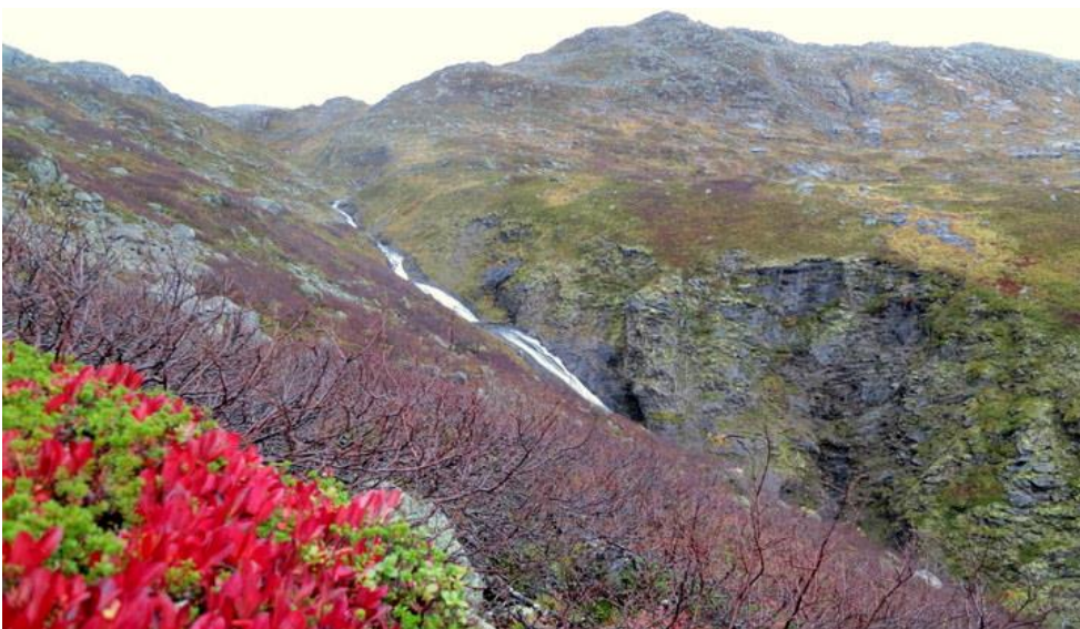
Figur 3. Moelv i høyfjellslandskapet med bekekløft til høyre i bildet.

Alternativ 2. med tunnel vil gi mindre inngrep enn hovedalternativet. Likevel forekom forslaget som lite utredet, samt at kostnadene vil bli meget høye. Grunnet lang avstand med tunnelboring må en sannsynligvis opp i dagen en eller to ganger på denne distansen. Vi mener at inngrepene både for alternativ 1 og 2 vil forringe allmenne interesser mer enn det beskjedne kraftutbyttet vil gagne samfunnsinteressene.