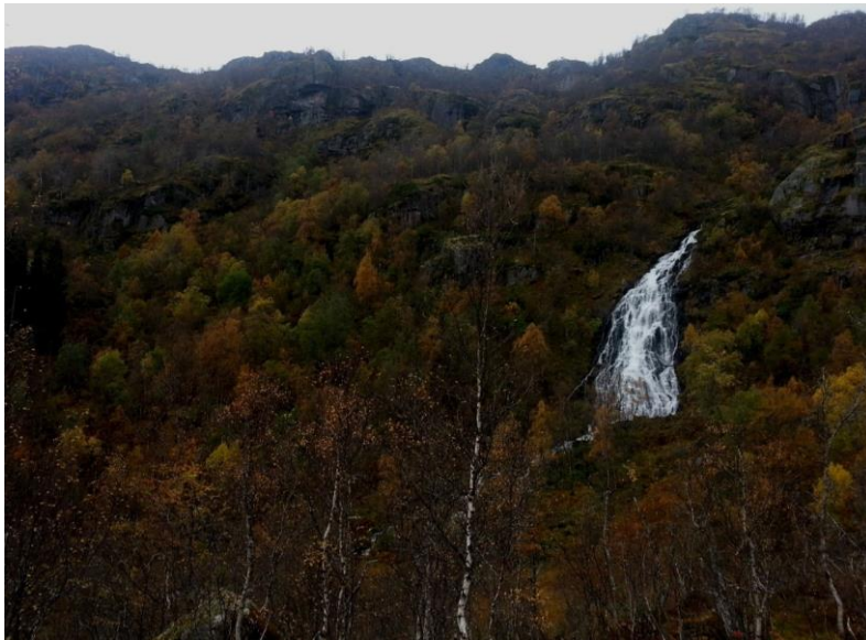
Figur 7. Svartskardfossen

Reduksjon av vannføring i berørt elvestrekning vil også redusere Svartskardfossen, som har et ca. 50 meter fall og fremstår som et fremtredende landskapselement (figur 7). Elva nedenfor fossen meandrerer ned til Gardsvatnet og må også betraktes som et spesielt landskapselement.