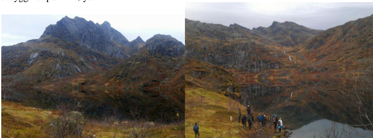
Figur 6. Planlagt inntak i Vasskrunvatnet.

Vi betrakter omfanget av inngrep ved en eventuell utbygging som vel store i forhold til forventet kraftproduksjon (4,30 GWh). Bygging av terskel i Vasskrunelva og graving/sprenging av inntak som vil medføre et ganske kraftig innhugg i et ”skjermet” landskap og idyllisk område som Vasskrunvatnet representerer (figur 6). I en samlet behandling av alle omsøkte småkraftverk på Hinnøya, som allerede er belastet med flere inngrep, må den relativt lille kraftproduksjonen vurderes opp mot samfunnsnyttene og alle inngrepene som planlegges. Alle prosjektene skal dessuten vurderes opp mot eksisterende utbygginger på Hinnøya.