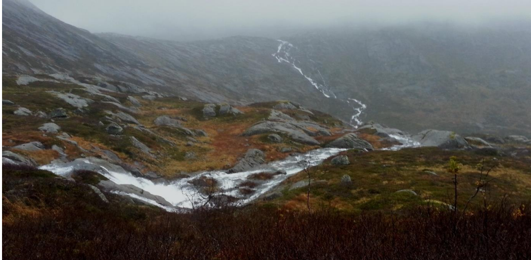
Figur 5. Kobbedalselva og bekken fra Trollvatnan i bakgrunnen.

Vi er fortsatt kritisk til oppdemming og regulering av Nedre Kobbedalsvatnet (alt. B) i forhold til naturmiljø og regulering av Trollvatnet (alt. A) i forhold til fisk, gytemuligheter og friluftsliv.