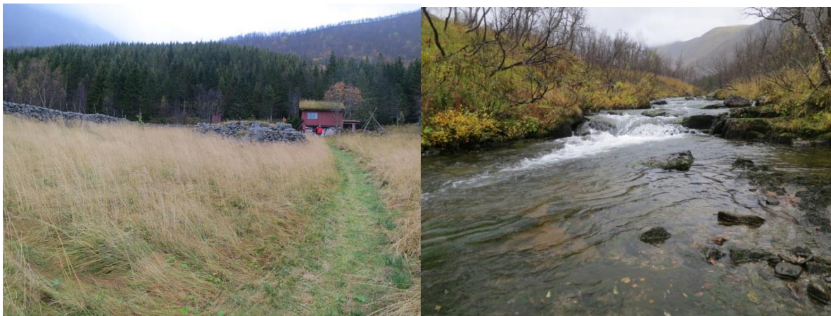
Figur 4. Kulturlandskapet i nedre deler av Lysåa, samt planlagt inntak i bildet til høyre.

Kulturmiljøet og landskapet i området har stor verdi. Dette gjelder især den gamle veien som ble fulgt under beifaringen. Veien ble bygd for hånd av bygdefolket for over 100 år siden (noen av de lokale mente at den var fra 1800-tallet) og ble brukt til å kjøre ned brensel, høy og slått, hovedsakelig med hest og slede. En evt. utbygging vil forringe deler av denne veien. Det kom fram under beifaringen at veien mest sannsynlig er fredet som samisk kulturminne. Dette må utredes nærmere og tillegges vekt i konsesjonsvurderingen. Det særegne kulturmiljøet som i dag preger området vil brytes ved en eventuell utbygging, både på nært hold, fra sjøsiden og fra andre siden av fjorden, noe som vil være konfliktfullt. Vi merket oss også konfliktnivået blant grunneierne i Lysåa.