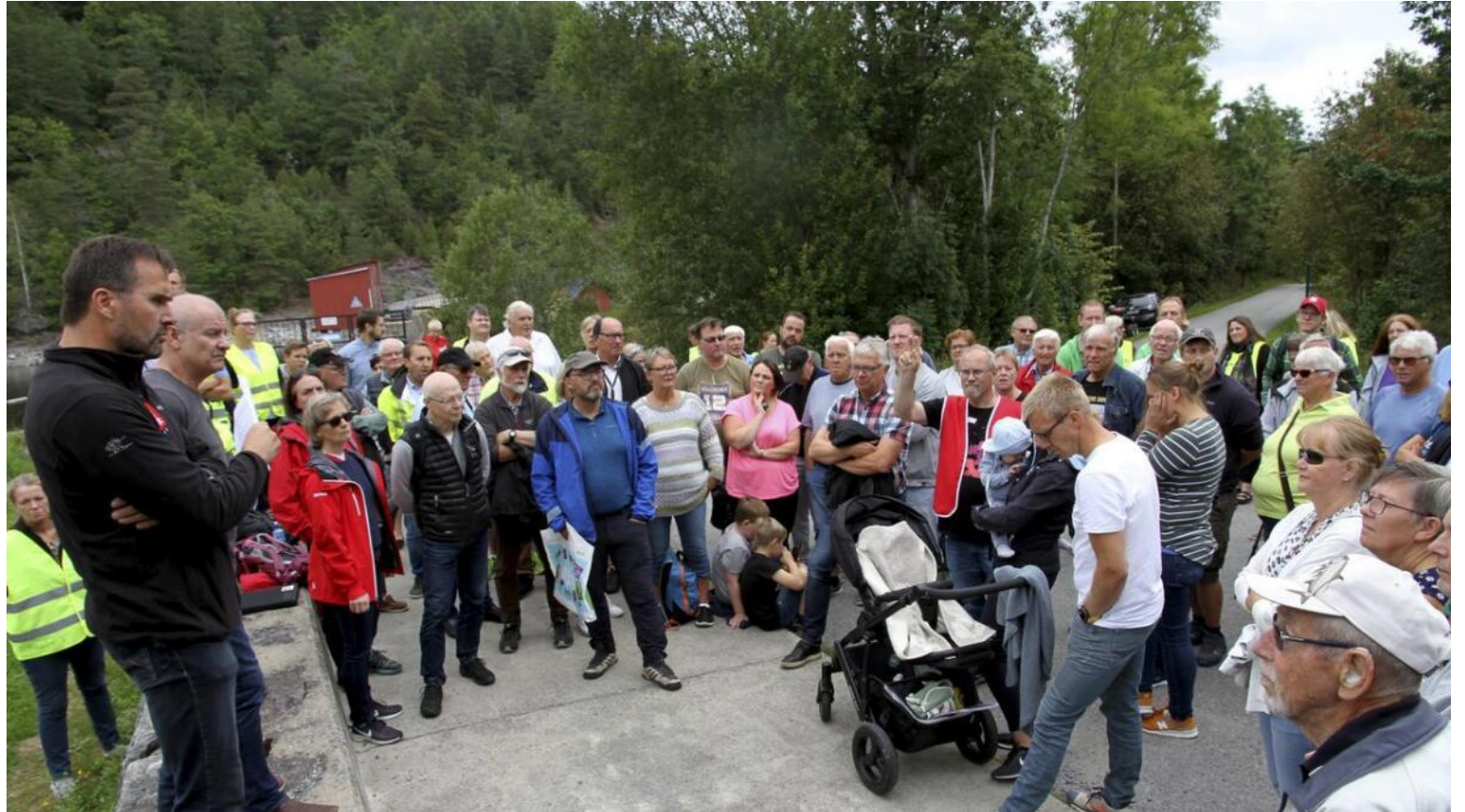
Befaring Kongens dam 2019