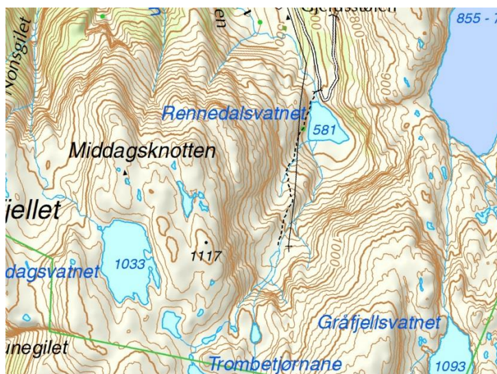
Figur 1: Stien forbi Rennedalsvatnet er stiplest inn på kart fra Statens kartverk. Utklipp her er fra norgeskart.no.

Verdi og virkning for friluftsliv er ikke omtalt i søknaden utover setningen «området er ikke brukt til friluftsliv». Rennedalsvatnet inngår i friluftslivsområdet Rosendalalpene – Folgefonna, en innfallsport til Folgefonna nasjonalpark. Området er vurdert som svært viktig i den regionale kartleggingen (fylkesnivå). Kvinnherad kommune har i utkast til pågående friluftslivskartlegging i kommunen, etter M98, kartlagt området hvor Rennedalsvatnet inngår og vurdert det som et viktig friluftslivsområde. Landskapsvirkninger blir for ofte kun vektlagt dersom det er betydelig aktivitet knyttet til området. En reguleringszone kombinert med en dam vil være ytterligere skjemmende visuelle inngrep i et område som har en klar verdi for friluftsliv med organiserte og uorganiserte turer. Den Norske turistforening har hyttene Breidablick og Fonnabu langs foten av Breidablickbreen. Organiserte turer til Folgefonna med overnatting på disse hyttene vil ofte gå stien langs Rennedalsvatnet (stien er stiplest på kart i Fig. 1) opp eller ned i stedet for den T-merkede stien fra Sunndal til Fonnabu. Stien langs Rennedalsvatnet er kortere, brattere og mange opplever denne stien som mer spektakulær. Stien ble opparbeidet av Statkraft og starten av stien går så tett i vannspeilet at den kan oversvømmes ved en eventuell regulering av vannet opp mot 585 moh. Vi viser til Kvinnherad turlags høringsuttalelse for ytterligere informasjon om områdets bruk og verdi for friluftsliv.