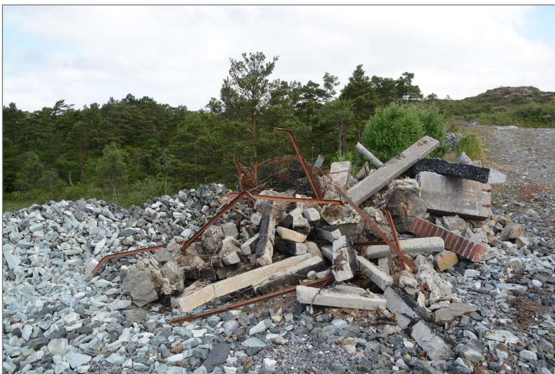
Bygningsavfall som ser ut til å ligge på Posten Eiendom Bergen AS sin tomt.