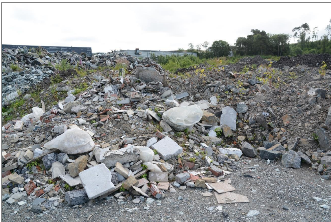
Mengder med parkslirekne (fremmed art) til høyre og ulovlig dumpet bygningsavfall til venstre.