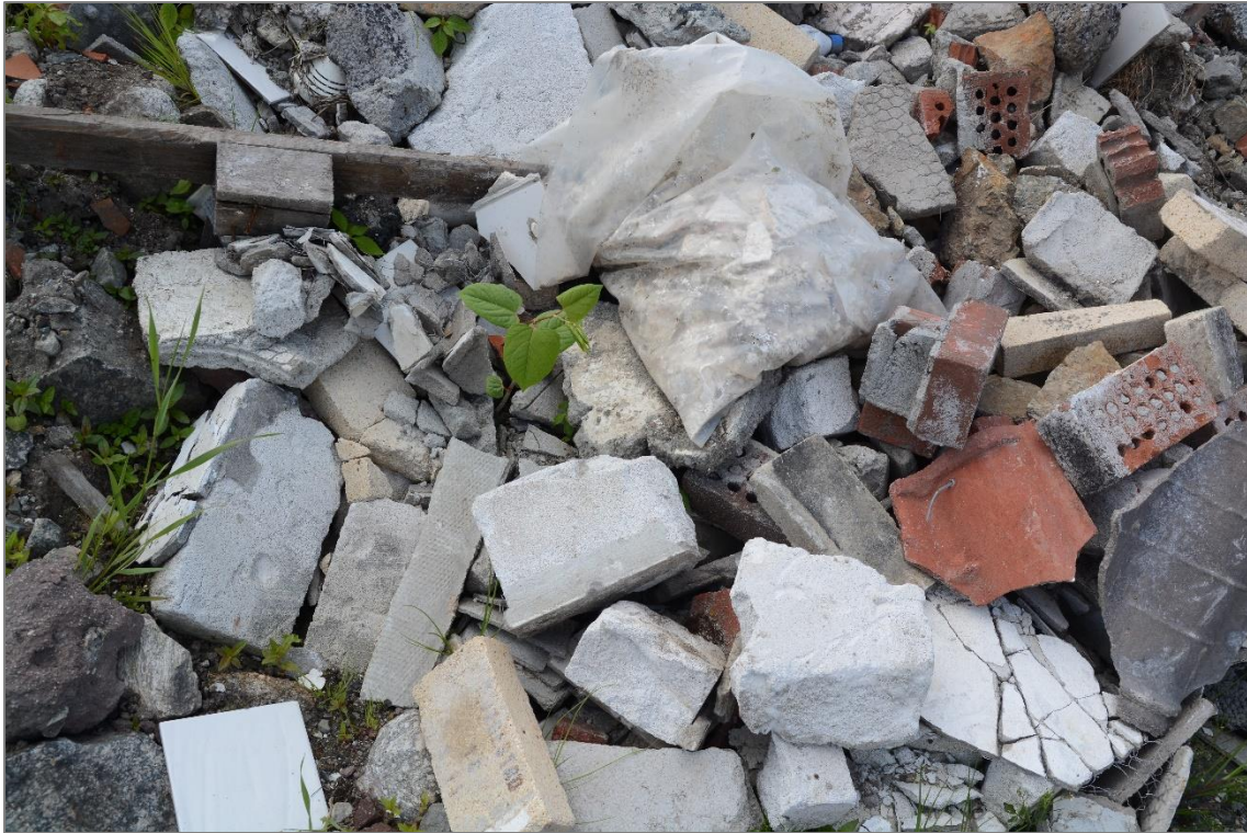
Nærmere bilde av bygningsavfallet som er vist på det første bildet – ispedd parkslirekne.