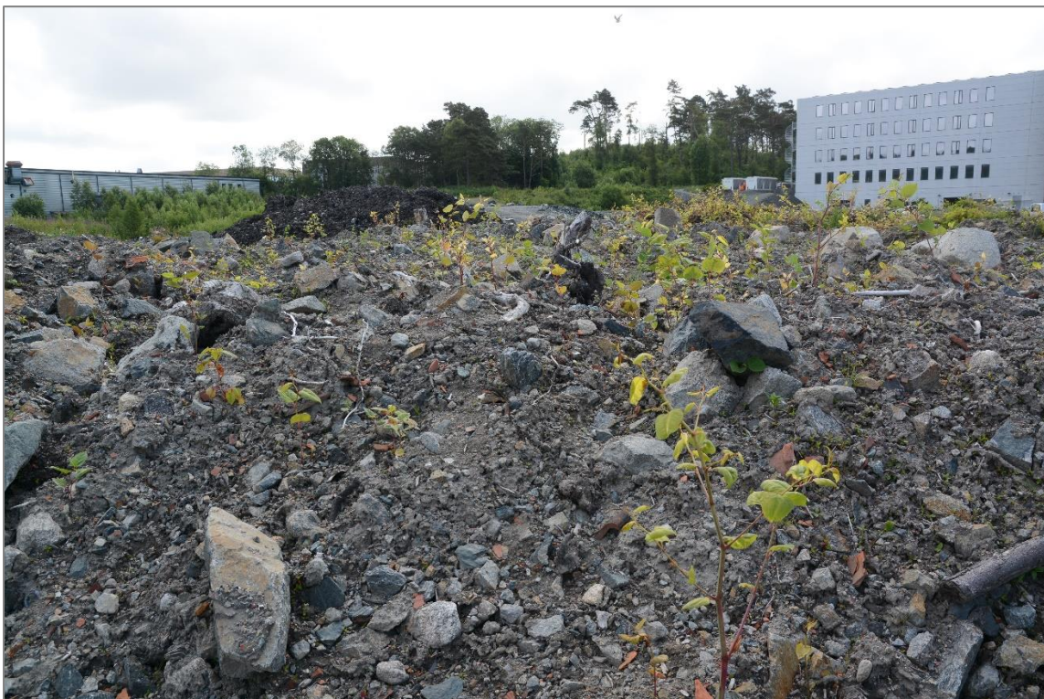
Bilde som viser mye parkslirekne innenfor planområdet. Forekomsten viser at man her ikke har tatt tilstrekkelige forholdsregler når det gjelder spredning av fremmede arter.