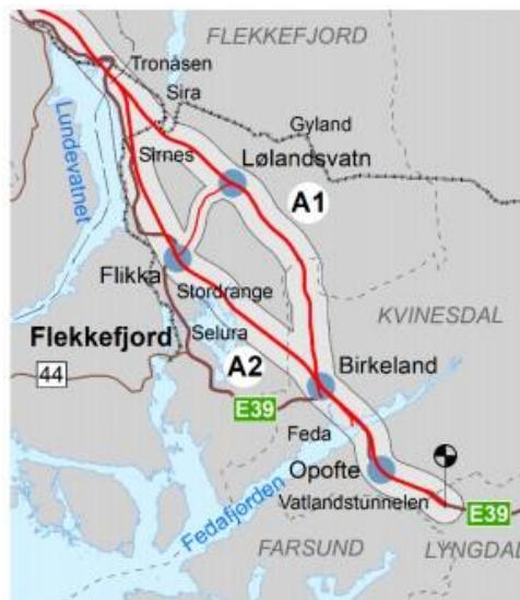
Figur 1: Oversikt over korridorer A1 og A2 i Agder.

Det er to alternative korridorer i Agder, som begge berører Lyngdal, Kvinesdal, og Flekkefjord kommuner (se fig. 1 hentet fra høringsdokumentet). FNF Agder er generelt for at nye veitraseer legges nærmest mulig eksisterende veganlegg for å begrense mengden nye inngrep. Vegutbyggingen i de to alternativene i høringsdokumentet vil føre til store inngrep og negative konsekvenser for naturmangfold og friluftsliv i begge korridorer. Korridor A2 kommer best ut av konsekvensutredningen når i fagrapport «Naturmangfold» og «Nærmiljø og friluftsliv», men på grunn av utredning om kostnader er det samlet gitt en anbefaling om korridor A1. Konsekvensutredningen viser altså at konsekvenser for natur og friluftsliv er størst der hvor anbefalt korridor er planlagt. Vi ber om at det legges stor vekt på ikke-prissatte konsekvenser som naturmangfold og friluftsliv ved valg av