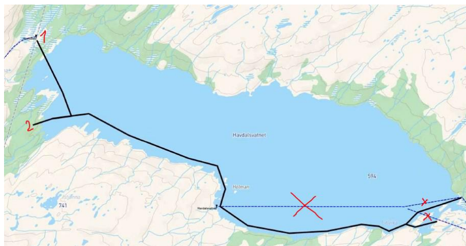
Figur 1: Traseforslag 1. Den tidligere isfiskeløypen skal forlenges og kobles på et stort nettverk av rekreasjonsløyper i Røyrvik i vest. Mørk strek er ny trase, blå strek med kryss er gammel isfiskeløype.

Forum for natur og friluftsliv Trøndelag er gjort oppmerksomme på et vedtak om nye rekreasjonsløyper i Lierne. Vi ønsker i denne uttalelsen å fokusere spesielt på traseforslag 1 (figur 1), som vi mener er ekstra problematisk av hensyn til natur og friluftsliv.