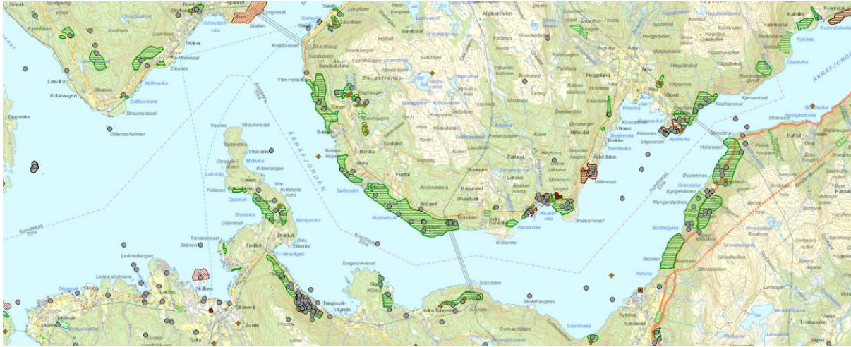
Figur 1: Naturbase - trase 1.0 og 1.1