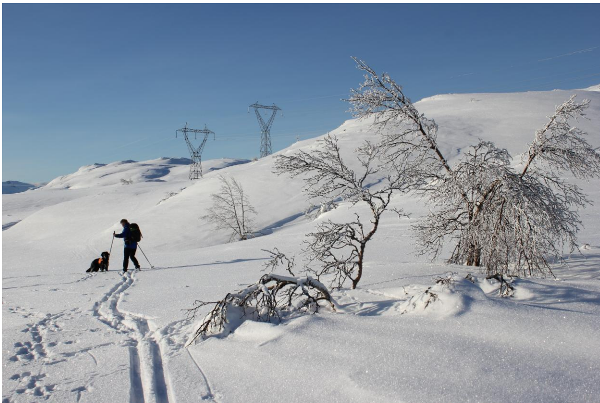
Vinterturruta frå Lingesete på veg mot Dueskardsvarden.

Kommentar; etter Dagmar låg ein laus nettkabel i snurr delvis dekt i snøen langs løypa slik at folk lett kunne hekta seg fast med skia under nedfart. Ved flytting av linetrase slik at denne berre krysser turruta istadenfor å gå nærast parallelt med denne vil det verte ein stor føremon, av omsyn til både tryggleik og naturoppleving.