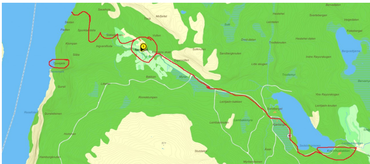
Figur 2: Inntegning av sti, mottatt fra lokalkjente