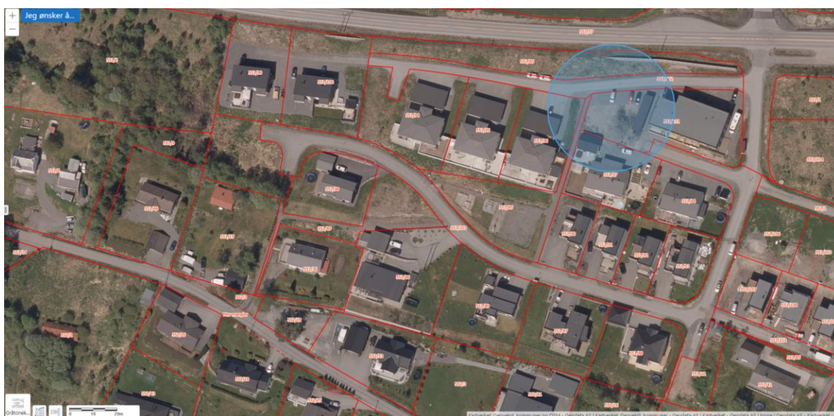
Flyfoto frå Stette med ring rundt erstatningsarealet (Gislink)

Nyleg tekne flyfoto tyder på at dette erstatnings-leikearealet er flatt bestående av grus/asfalt og ligg inn i vegen og blir brukt som parkeringsplass (sjå flyfoto under). Dette kaller ikkje vi fullgodt erstatningsareal og eit godt bytte mellom fellesinteressene og private interesser. Ungar treng natur og ujamn mark, ikkje flate grusplasser inn i veg eller gummierte leikeplassar. Og dette med at eksisterande leikeareal ikkje er i bruk kan vel skyldast fleire årsaker. Om dette står det ingenting i nemnd i saksutgreiinga, men vi kan jo tenkje oss fleire grunnar som eigarskap til tomta, lite med ungar akkurat no her etc