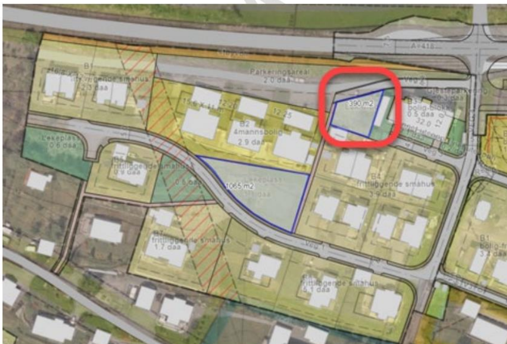
Figur 13 Uteoppholdsareal Lek/fritid og andre i nærområdet.

Vi les i planbeskrivelsen av 03.11.2022 at; « ... det er nok felles leikeareal med god kvalitet. » Blant anna blir det vist til eit område på 390 m 2 som vil bli opparbeida som nærleikeplass (sjå kart under). Under dette punktet står det; « I nærområdet, innenfor gjeldende reguleringsplan, er det nok felles leikeareal med god kvalitet. De innfrir kravet i kommunedelplanen for Skodje om 36 m 2 per boenhet. Leikearealene har god kvalitet, solrik plassering og er adskilt fra kjøreveg med gjerder eller beplantning. »