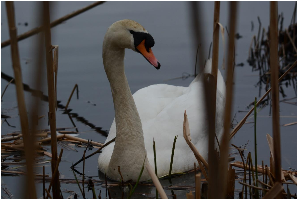
Bilder fra Solheimsvatnet (13. april 2023), som viser de hekkende artene sothøne og knoppsvane – i kantvegetasjonen.