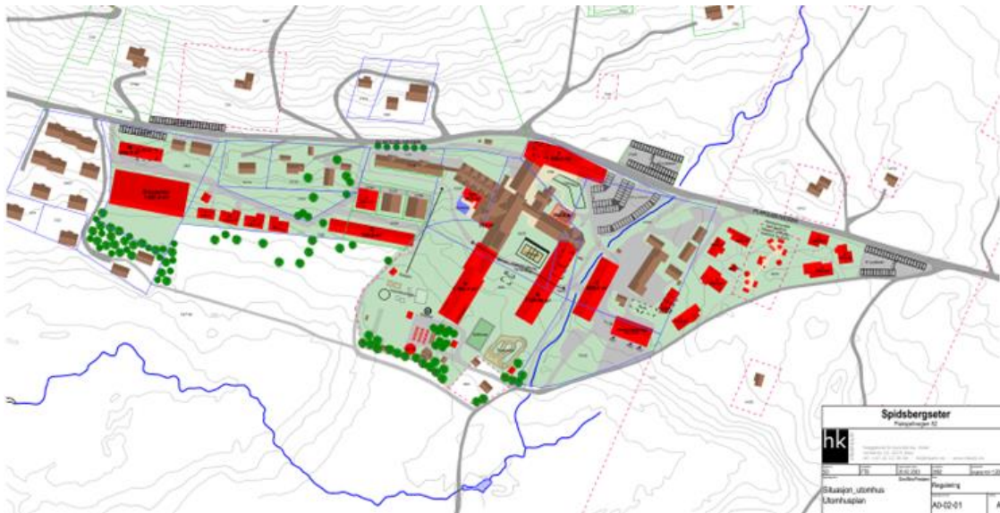
Figur 2: Brune bygg er eksisterende bygg, rødt er planlagte nybygg i detaljreguleringsplanen. Eksisterende hotellkompleks er brunt bygg midt i kartet. Sør for dette er det planlagt to nye hotellfløyer i rødt. Brune bygg vest for hotellet er solgt til private og drives etter prinsippet «sale and leaseback».

aktivitetstilbud, med innendørs ridehall, Spa-anlegg, aktivitetsbygg (mulig innhold bowling, kino og lignende aktiviteter) og uteområde (muligheter for lavvo, akebakke, bål/grillplass og servering).