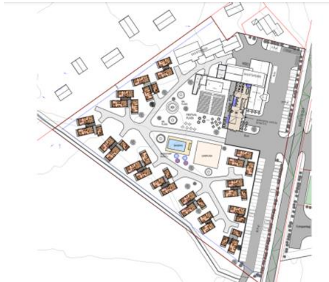
Figur 3: Plankartet for Fyst Rondevegen, hvor campingen flyttes til sør i planområdet, og hvor det anlegges servicebygg, utleieleiligheter og aktivitetsområder der campingen har vært (nord i planområdet, vest for FV27). Illustrasjonsskissen til høyre viser tunvis plassering av utleieenheter. Øst for FV27 planlegges opparbeidet som aktivitetsområder med aktivitetspark, flerbrukshall, serviceanlegg, zip-line og uteservering.