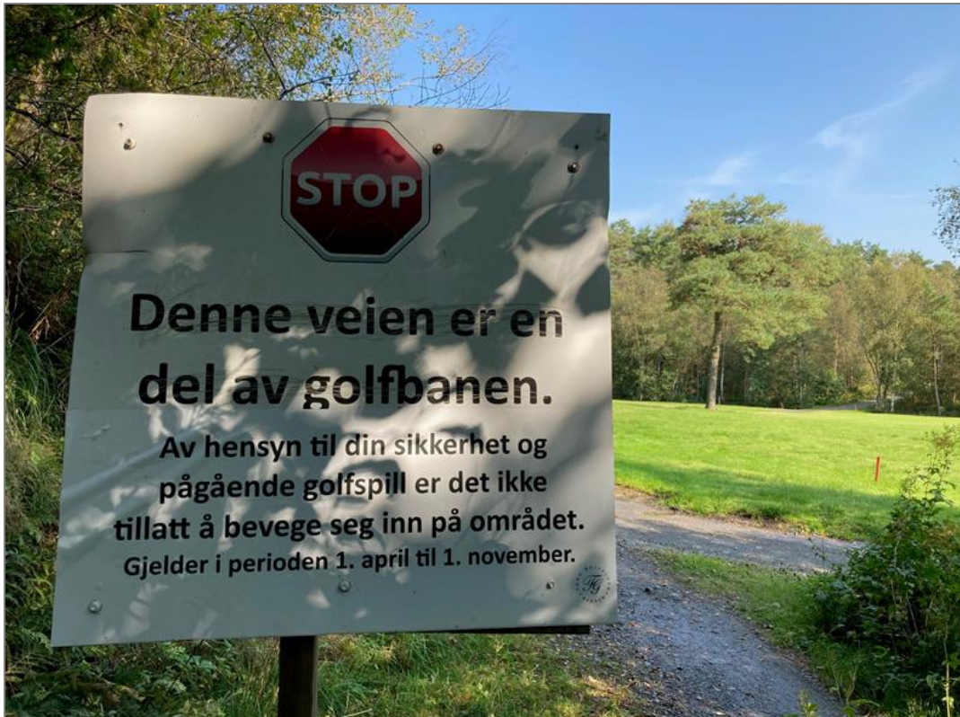
Slik ser skiltingen ved Fana Golfklubb ut. Denne type ferdselsbegrensende tiltak for allmennheten har trolig golfklubben ikke anledning til å gjøre.