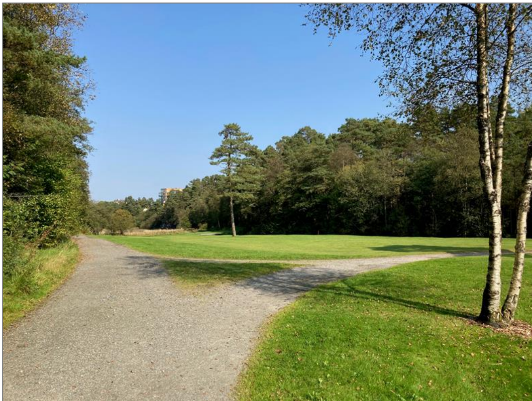
Slik ser de grusede veiene ut langs golfbanen. Det er allmenn ferdsel på disse veiene som Fana Golfklubb prøver å forhindre gjennom skiltingen.